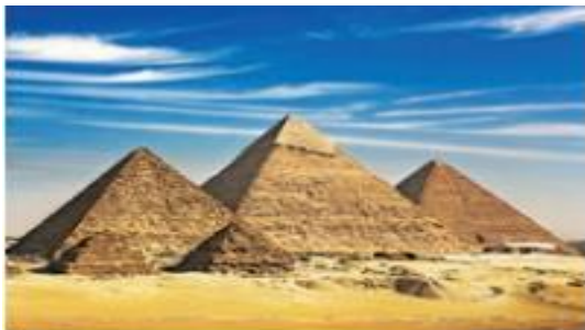
▲ Las pirámides de Guiza. La mayor (tumba del faraón Keops) terminó de construirse hacia el 2550 a. C.