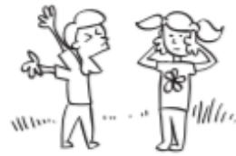
Gritarle al amigo si no está de acuerdo contigo.