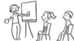
Escuchar cuando los demás hablan.