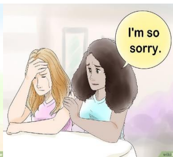
Toma en cuenta los sentimientos de los demás