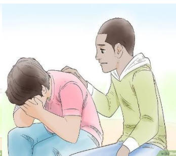
Ponte en el lugar de los demás