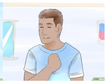
Respétate a ti mismo