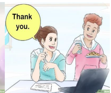
Trata a los demás de manera cortés y educada