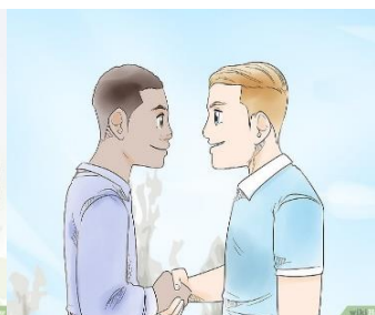
Comunícate con respeto