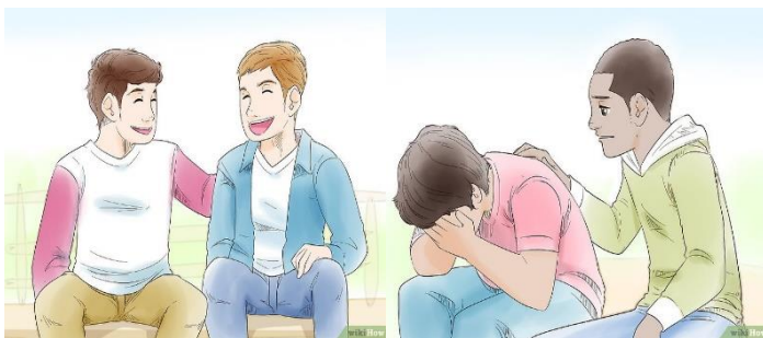
Trata a los demás como te gustaría que te traten