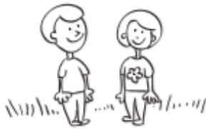
Dar su opinión con tranquilidad.