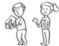
Tomar cosas de los demás sin su permiso.