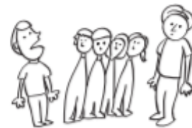
Hablar sin que le pregunten en clases.