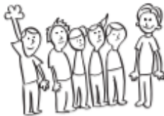
Indicar para tomar la palabra.