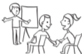
Conversar con el amigo mientras otro les habla.