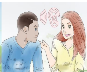
Formula tus comentarios de manera respetuosa