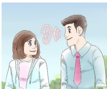
Comunícate con respeto