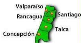
Salto del Laja

Se extiende desde el río Aconcagua hasta el río Biobío e incluye las regiones de Valparaíso, Metropolitana, Del Libertador Bernardo O'Higgins, del Maule, y la región del Biobío.