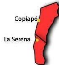
Valle del Elqui

Se extiende desde el río Copiapó hasta el río Aconcagua e incluye las regiones de Atacama y Coquimbo.